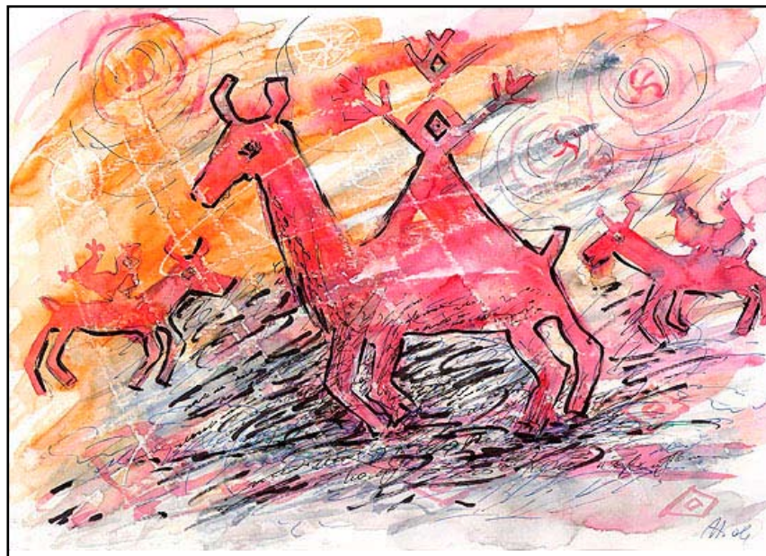
Год-олень, бум\акв, 21 X 29, 2006