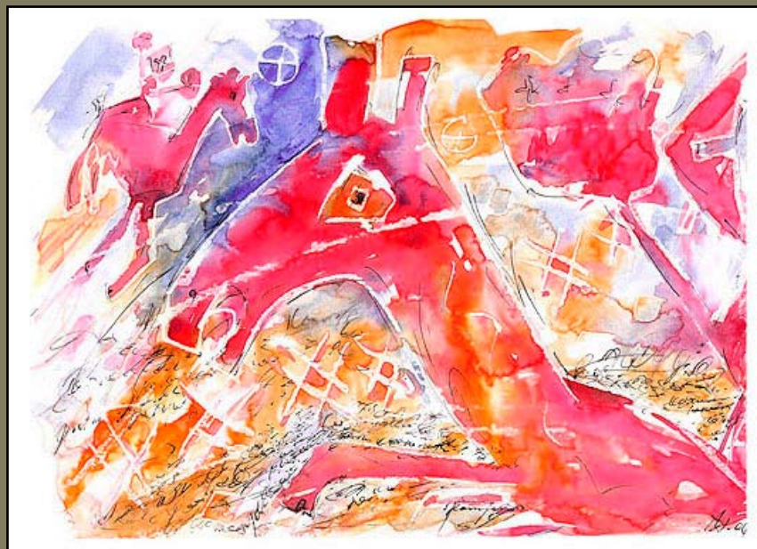
Олень, бум\акв, 21 X 29, 2006