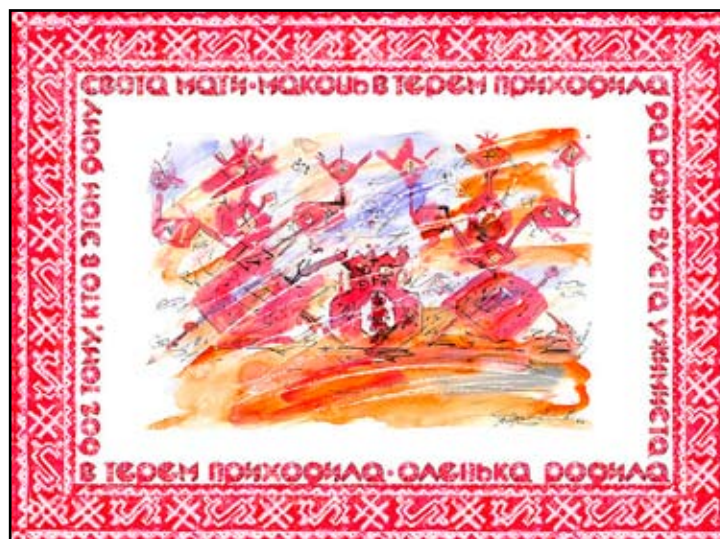
Мати , смеш.техн., 2006