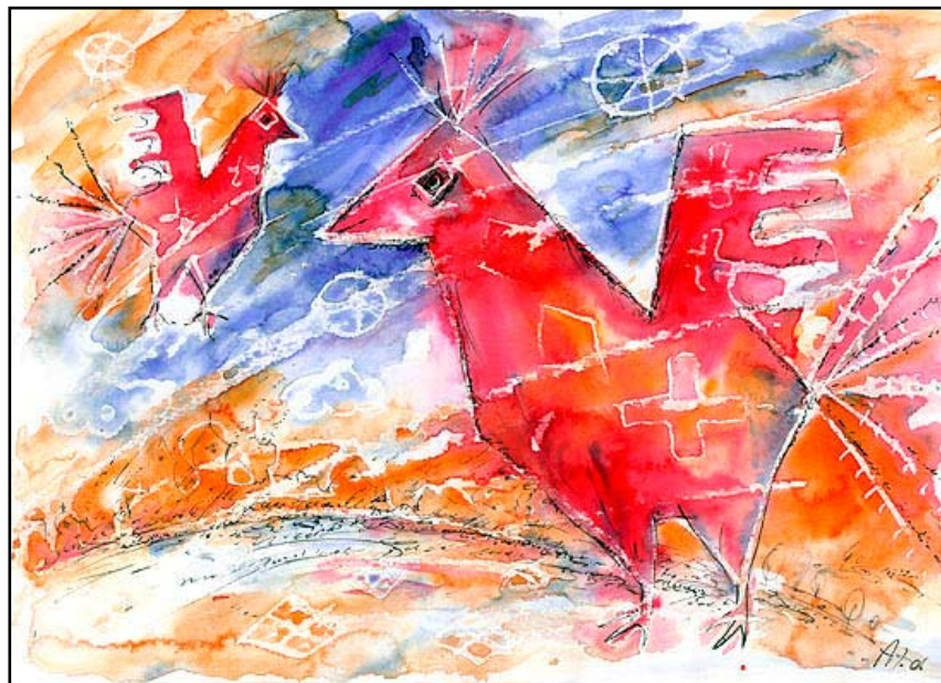
Жар-птицы 1, бум\акв, 21 X 29, 2006