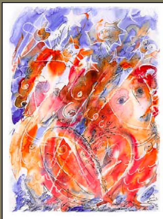
Сирин и Алконост, тушь\бум, 21 X 29, 2006