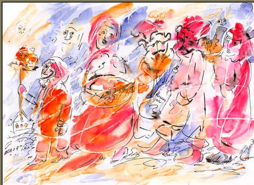
Идет коляда, бум\акв, 21 X 29, 2006