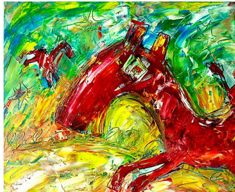
Год-олень, х\масло, 30 X 50, 2006