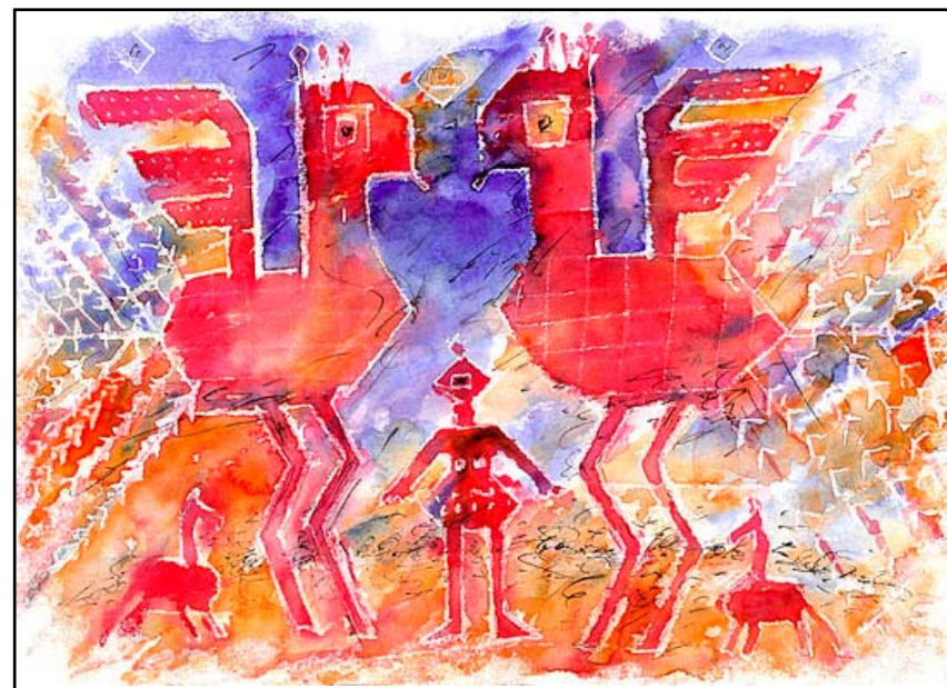
Жар-птицы 2, бум\акв, 21 X 29, 2006