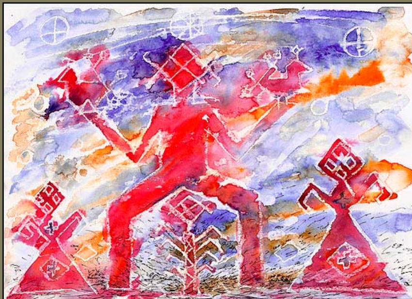
Основание, бум\акв, 21 X 29, 2006