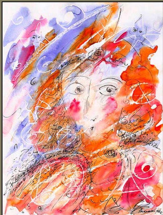
Сирин, акв\бум, 21 X 29, 2006