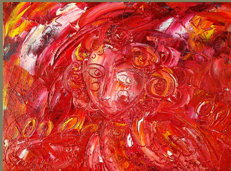
Алконост, масло, 30 X 50, 2006