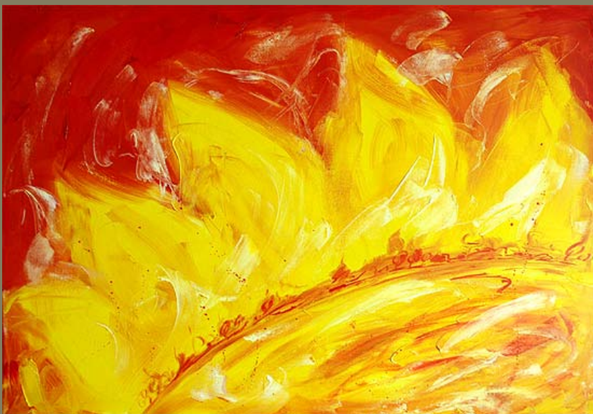
Солнце, х\масло, 60 X 80, 2006