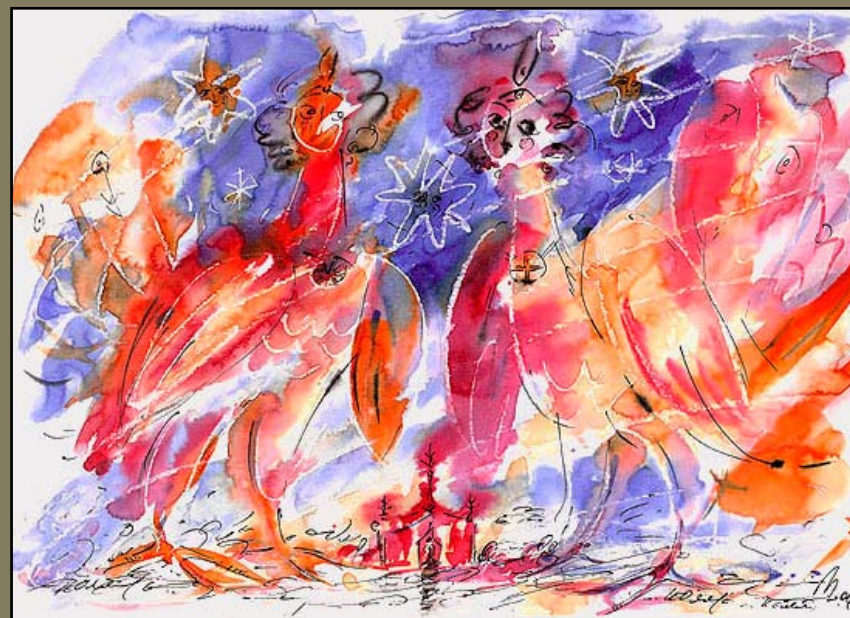
Птицы, бум\акв, 21 X 29, 2006