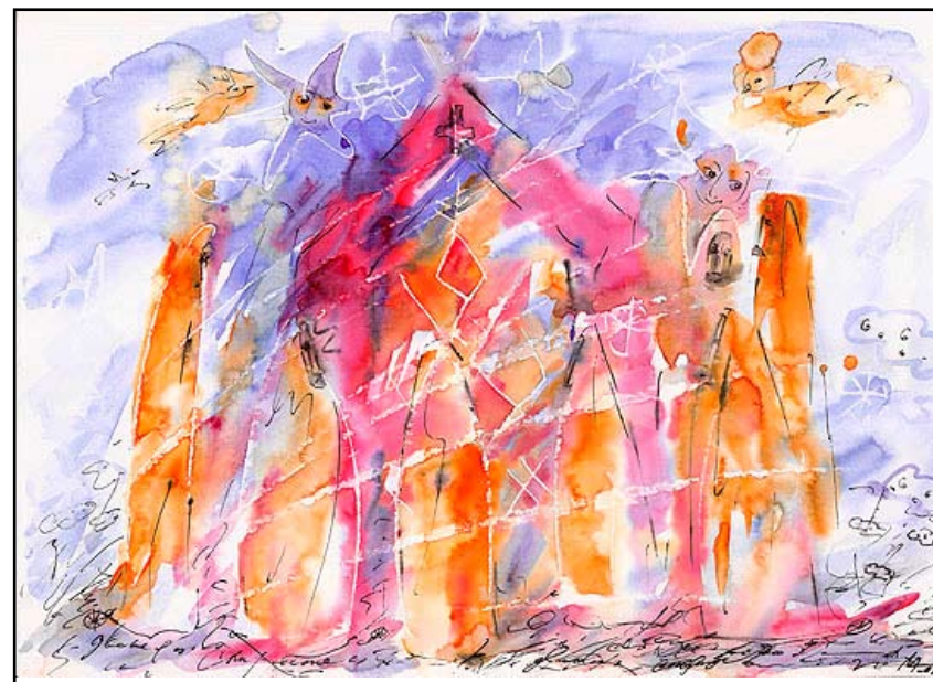
12 дедов, бум\акв, 21 X 29, 2006