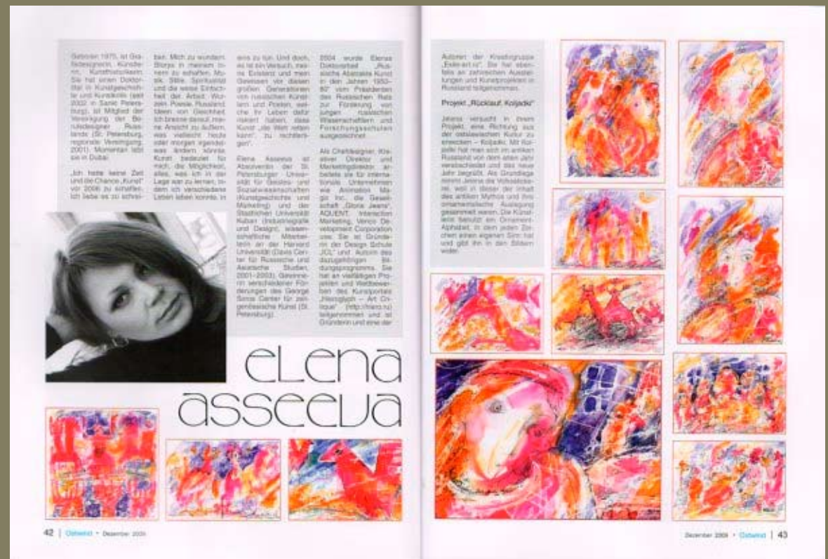
Ostwind Kunst & Integration Magazine. December 2009