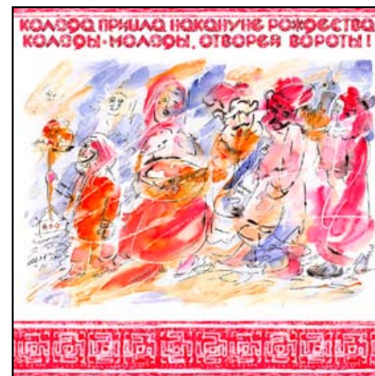
Дай Вам, смеш.техн., 2006