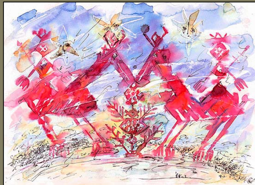
Рождение 2, бум\акв, 21 X 29, 2006