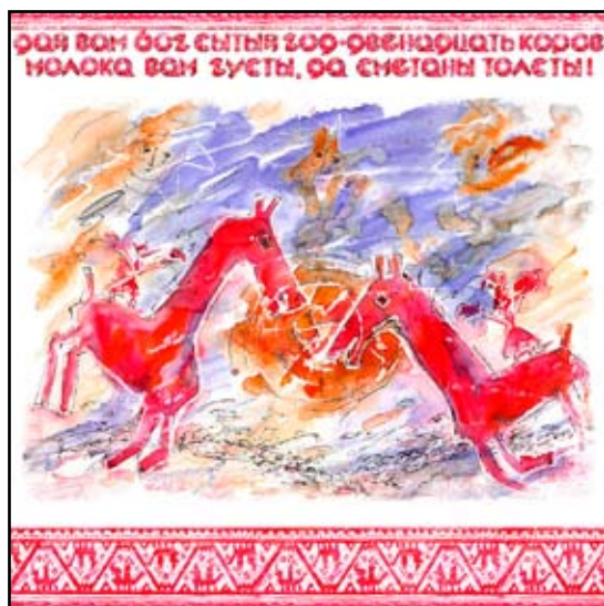
Дай Вам, смеш.техн., 2006