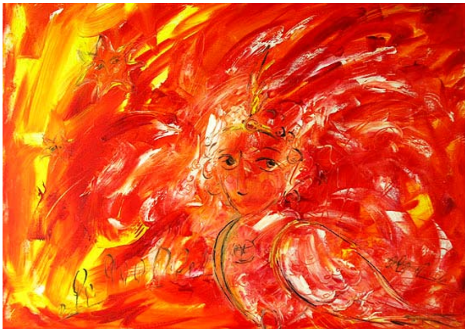
Финист, х\масло, 60 X 80, 2006