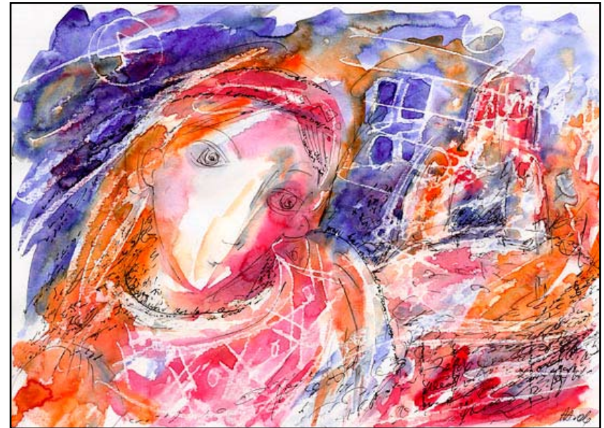
Святки 2, бум\акв, 21 X 29, 2006