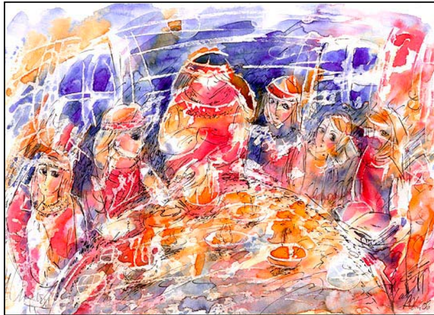
Святки 1, бум\акв, 21 X 29, 2006