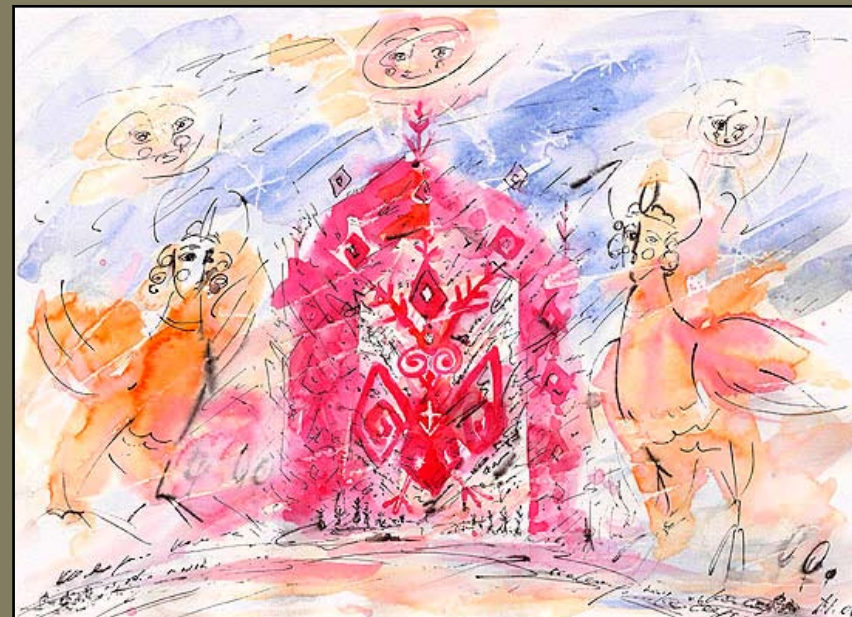
Рождение 1, бум\акв, 21 X 29, 2006