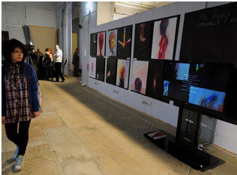
Проект “Дневник” ; холст, акрил, видео, книга, 2010 г. Выставка в музее им. Коваленко (Краснодар).