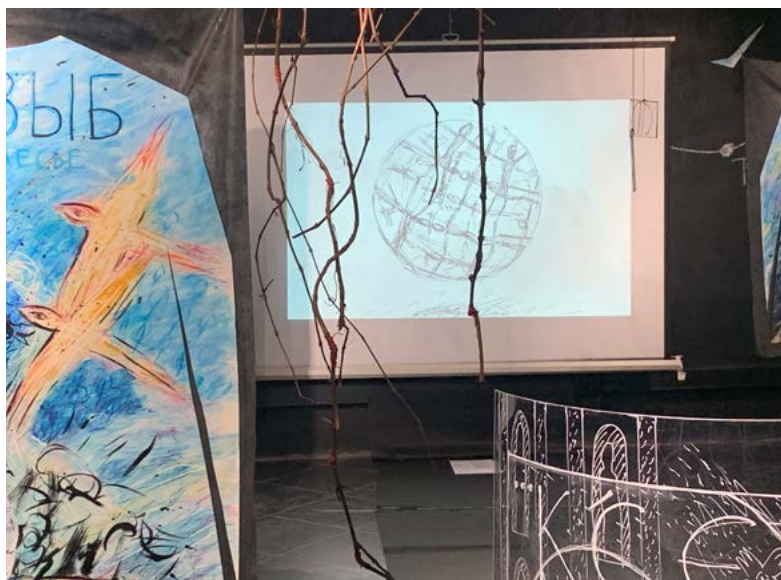
Проект “Река Догуб” . Экспозиция проекта на выставке “Река Догуб” в галерея Glubina (2023)

Методом художника является иллюстрирование в разных медиумах, от графики до видео и объекта, собственных текстов – как поэтических, так и прозаических. Исследовательской темой художника является отношение времени и истории, в частности, история Кавказа, Византии, альтернативная история, вопросы трудного исторического наследия. Повествовательность, автобиографичность характерны для художника, где работы являются всегда частью одного бесконечного текста.