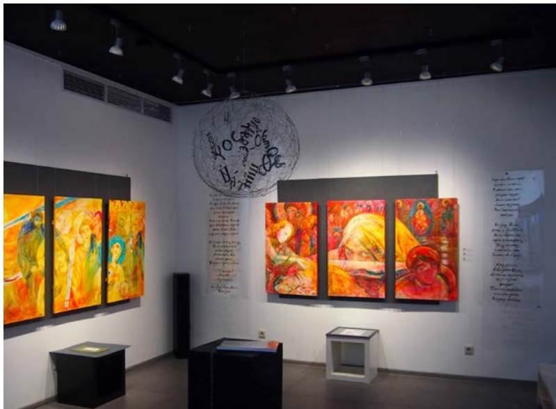
Проект “Круговорот” ; дерево, акрил, объект, видео, книга, 2015. Выставка в галерее IN (Новороссийск).