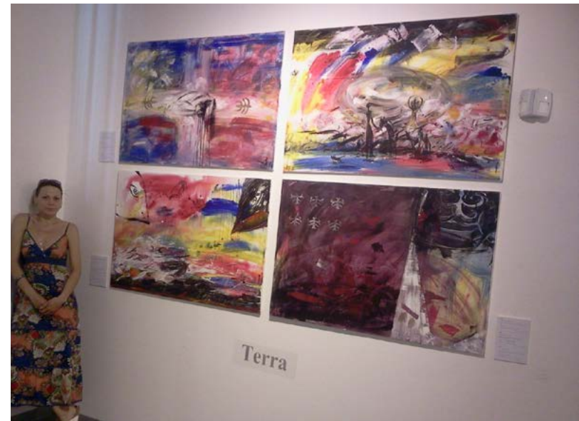
Проект “Сокровища воспоминаний” , 2012, холст, акрил, видео, книга, 2010 г. Выставка в Officine Fotografiche и Palazzo Santa Croce (Рим).