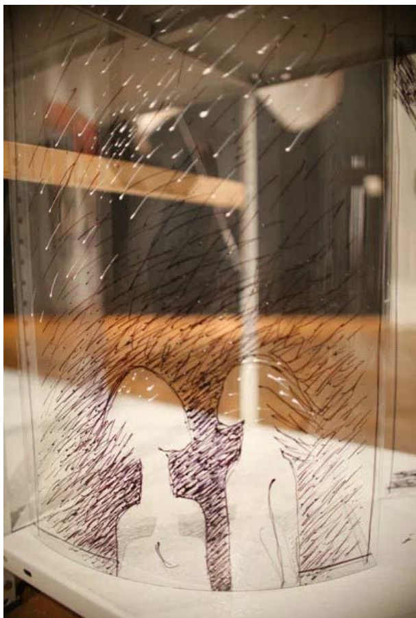
Проект “Прометей” , пластик, акрил, 65X45 см, 2022. Выставка “Мифохранилище”, галерея На Каширке (Москва).

2023 “Кавказская Атлантида” (куратор, художник, руководитель проекта), при поддержке гранта ФПГ, галерея “Глубина”, г. Москва